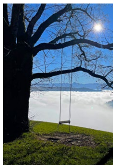
Friedenslinde im Winter von Marianne Schmutz

Erscheinung: 1x jährlich Vereinsadresse: gemeinsam für biglen, 3507 Biglen www.gemeinsamfuerbiglen.ch Redaktion: Vorstand «gfb» Bilder: zur Verfügung gestellt und von Adobe-Stock Layout: Alexandra Flückiger-Schneider Druck: schneiderdruck.ch